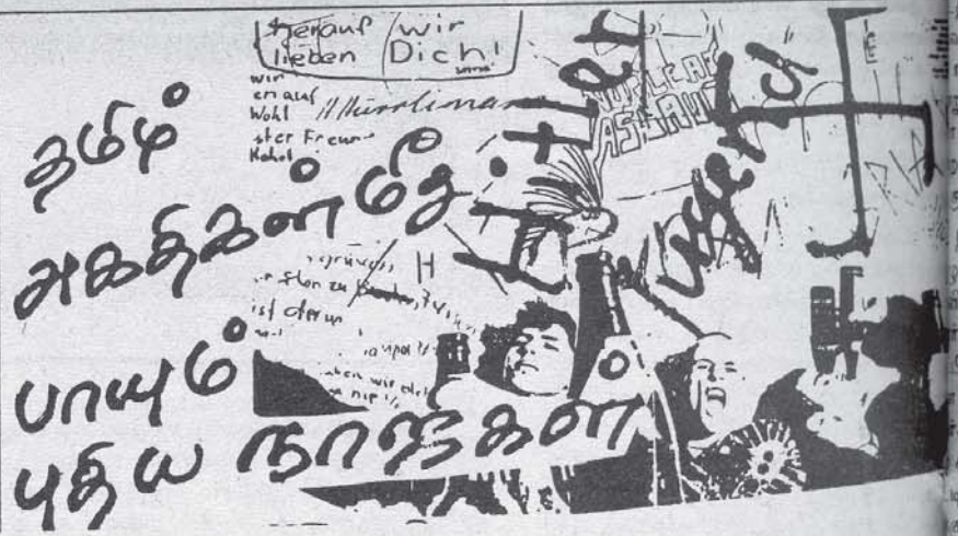
புதிய நாஜிக்கள்; "மனிதம்" ஏட்டில் வெளியான படம்.