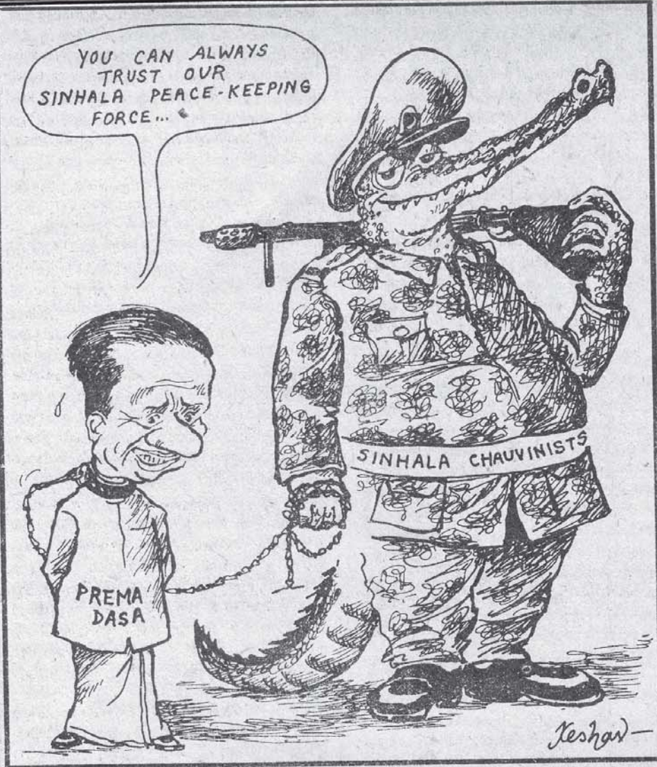
சிங்கள இனவெறியிடம் சிக்கிக் கொண்டுள்ள பிரேமதாசா - தி இந்து

ளா அக்பரை ஆசிரியராகக் கொண்ட காங்கிரசு எம்.பி.யின் கல்கத்தா ஏடு 'தி டெலிகிராஃப்'. 'பிரேமதாசாவுடன் பேசிவிட்டு அரசு விமானத்தின் மூலம் காடுகளில் உள்ள பதுங்குமிடங்களுக்குப் புலிகள் திரும்பியதை அவருடைய நாட்டைக் காப்பதற்காக ரத்தம் சிந்திய இந்திய இராணுவம் அதிகமாகும் கோபத்தோடு கவனித்தது. மற்றவர்களைப் போலவே ராஜீவைக் குறைத்து மதிப்பிடுகிறார். பிரேமதாசா எப்போதும் தயாராய் உள்ள தனது ஆயுதத்தைப் பிரயோகித்துள்ளது புதுடிவில். இவ்வளவு அப்பட்டமாக பிரேமதாசா மாறும்போது, ராஜீவ் தான் யாரென்பதைக் காட்டுவதற்கு வெகுநேரம் ஆகாது. இந்தியர்களை வெளியேற்றினால் தனி ஈழத்தைப் பிரகடனம் செய்வோம் என்று வரதராஜப் பெருமாள் அறிவித்ததே பிரேமதாசாவை சுயநினைவுக்குக் கொண்டு வந்திருக்கும். ஜெயவர்த்தனேவுக்கு மகிழ்ச்சியூட்டுவதற்காக இந்திய இராணுவம் அனுப்பப்படவில்லை என்பதை பிரேமதாசா மறந்து விட்டார். இந்தியாவின் நலன்களும் கூட சம்பந்தப்பட்டிருக்கிறது. தமிழர்களைக் காப்பதோடு, இந்தியாவுக்குப் பகையான சக்திகள் இலங்கையைப் பயன்படுத்துவதை முறியடிக்கவும் தான் போய்ள்ளது. பலவீனமாய் இருந்தும் மிகவும் அலட்டிக்