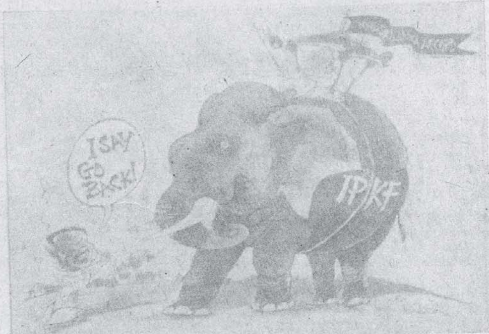
''யானை''யை எதிர்க்க என்ன துணிவு வேண்டும் என்பதாக - தி வீக்

இவை அனைத்தும் பற்றிய உண்மை விவரங்களை அரசு அதிகாரிகளுடன் உள்ள நெருக்கமான உறவுகள்; தமது சொந்த நிரு பர்கள் அனுப்பும் தகவல்கள் ஆகியவை மூலம் முதலாளித்துவ ஏடுகள், குறிப்பாக ஆங்கில ஏடுகள் நன்றாகவே தெரிந்திருந் தன. இருந்தும் பாசிச ராஜீவ் கும்பலின் ஆக்