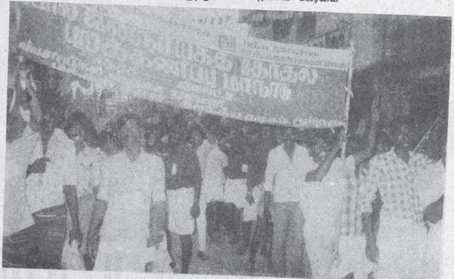
பொங்கியெழுந்து வீசும் புரட்சிப் பேரவை

கருத்துறைகள் வழங்கிய தோழமை அமைப்புகளான, மக்கள் ஜனநாயக இணை