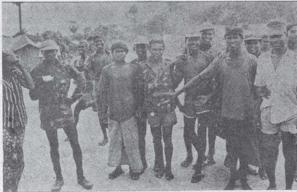
ஈழத் தமிழனை வைத்து ஈழத் தமிழனைக் கொல்ல குடிமக்கள் சேவைப் படையைக் கட்டி ஆயுதப் பயிற்சியளித்து வருகிறது இந்திய இராணுவம். மட்டக் கிளப்பு பயிற்சி முகாமில் ஈ.பி.ஆர்.எல்.எஃப் இளைஞர்கள்.

40,000 இராணுவப் படையினர் கூடவே ‘பச்சைப் புலிப்படை’ ஆளும் கட்சி கொலைகாரர்களையது. “பலபத்து ஜே.வி.பி.பினர் றுக்கணக்கான அதன் ஆதரவாளர்களை பிடித்துக் கொண்டு தெருக்களிலே தள்ளி” “இராணுவமும் அதன் படைக் குழுக்களும் அதன் பயங்கரவாதத்தை கட்டவிழ்த்து அம்பிதியே கிராமத்தில் அவர்களை வீடுகளில் இருந்து இழுத்துப் போடும் பையன்களின் பிணங்கள் தெருக்களில் இறைந்து கிடந்ததை பத்திரிகை பார்த்தார்கள். அவர்கள் ஓவ்வொரு தலையிலே சுடப்பட்டுக்